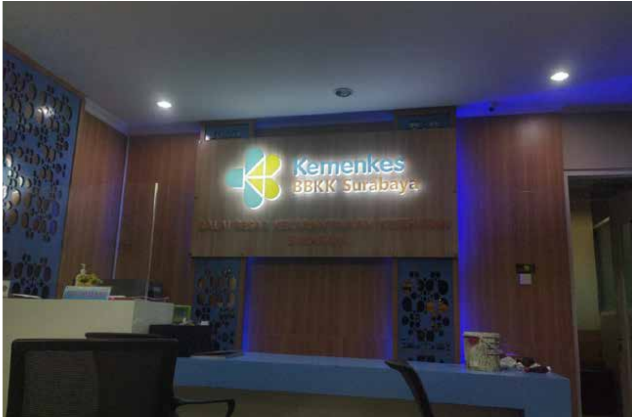
Lobby Kemenkes BBKK Surabaya