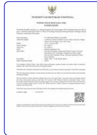
Nomor Induk Berusaha (NIB)