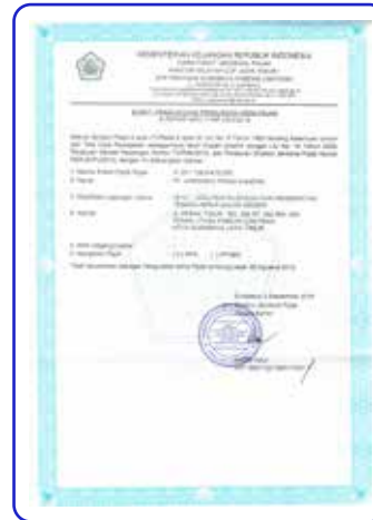
Surat Pengukenan Pengusaha Kena Pajak