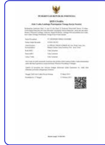
Izin Usaha Lembaga Penempatan Tenaga Kerja Swasta