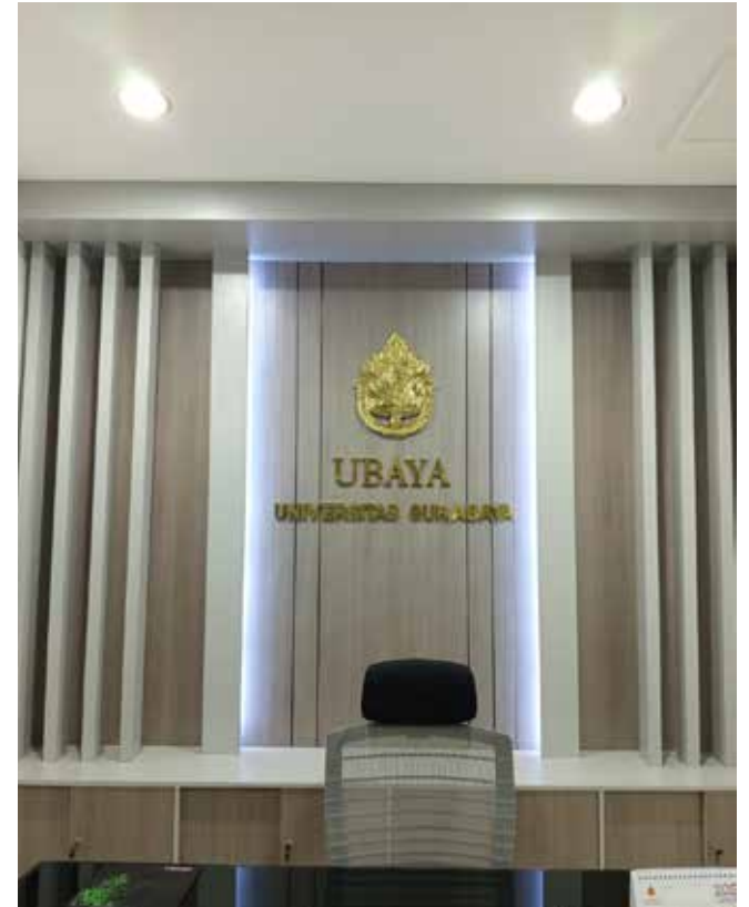
Ruang Meeting Kantor UBAYA