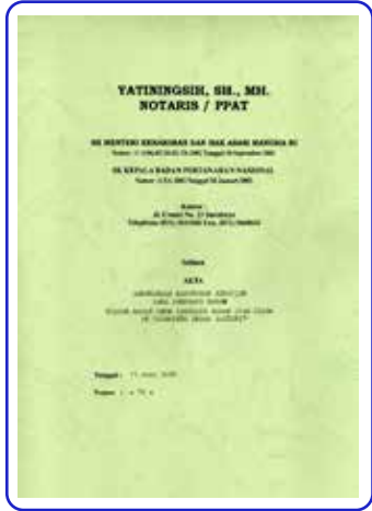
Akta Perubahan No. 19