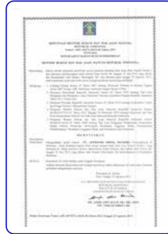
SK Kemenkumham Akta Pendirian 86