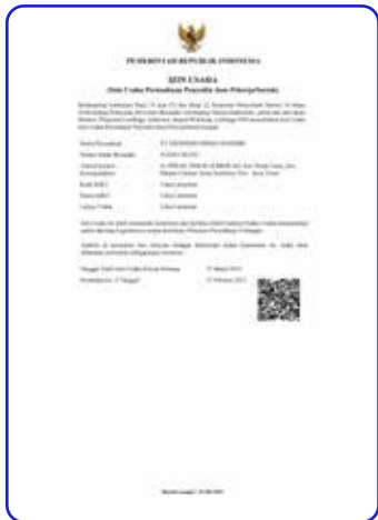
Izin Usaha Perusahaan Penyedia Jasa Pekerja / Buruh