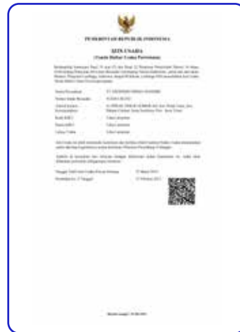
Izin Usaha Pariwisata