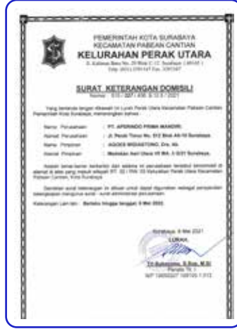
Surat Keterangan Domisili