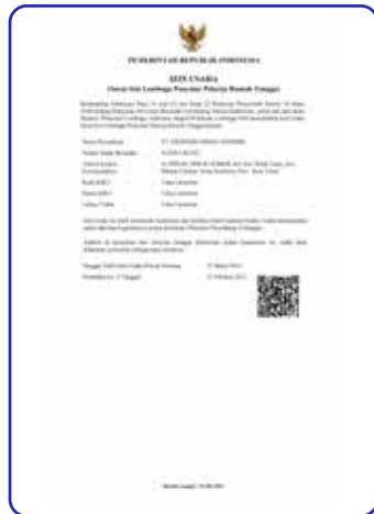
Izin Usaha Lembaga Penyalur Pekerja Rumah Tangga