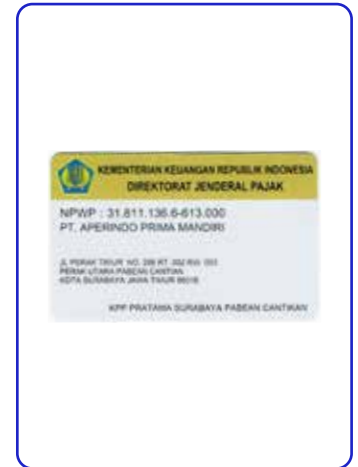
NPWP Direktorat Jenderal Pajak