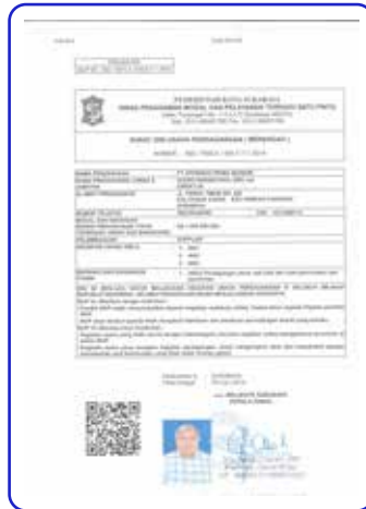
Surat Izin Usaha Perdagangan (SIUP)