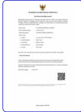
Izin Komersial / Operasional