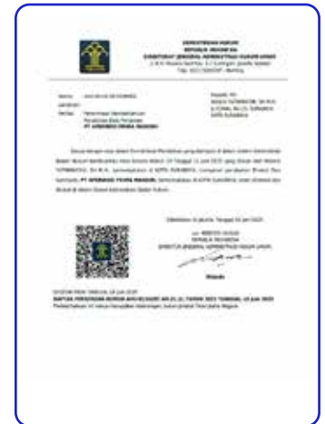
SK Kemenkumham Akta Perubahan 19