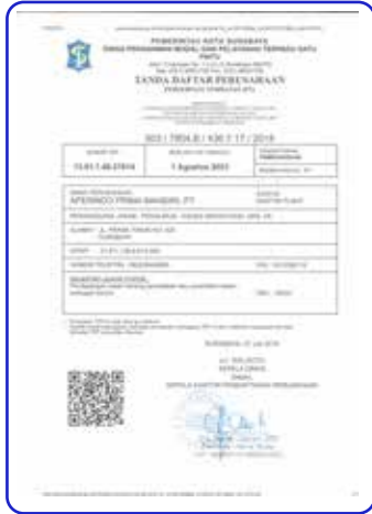
Tanda Daftar Perusahaan (TDP)